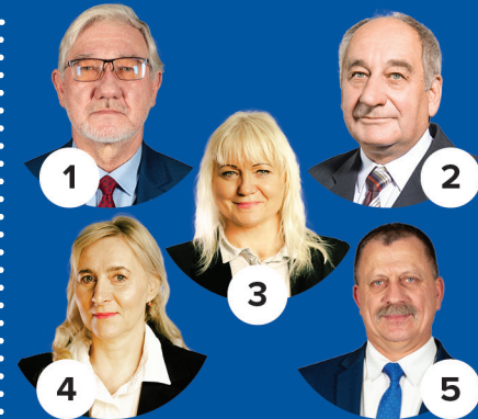
Okręg wyborczy nr 3 gminy: Czarna, Lutowiska