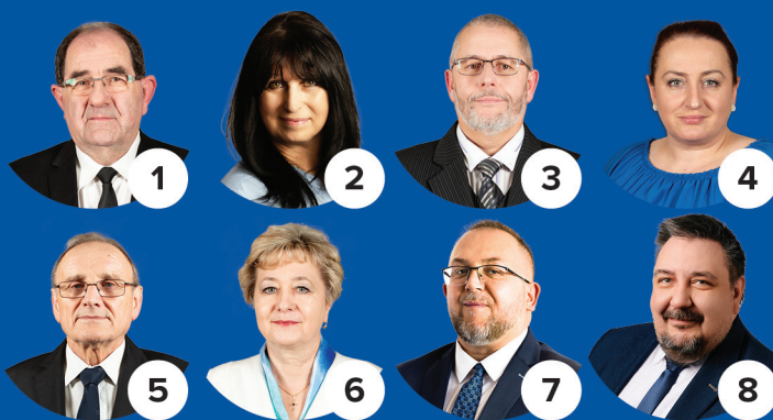
Okręg wyborczy nr 2 gmina Ustrzyki Dolne (teren wiejski)