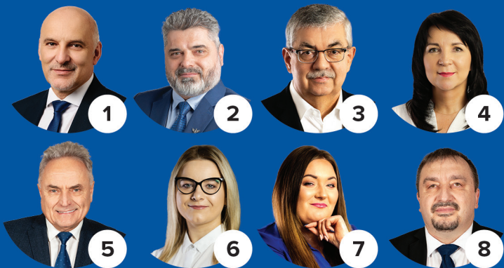
Okręg wyborczy nr 1 miasto Ustrzyki Dolne